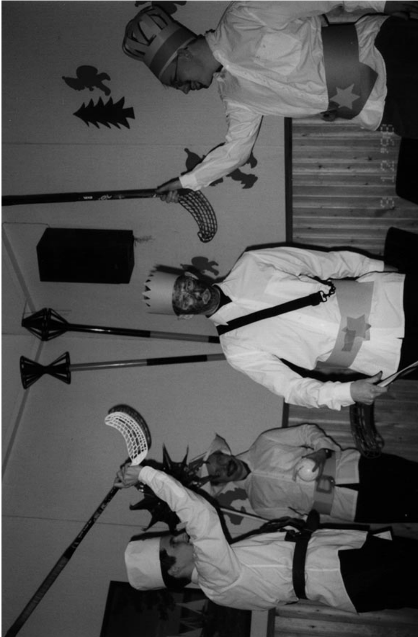
Pikkujouluissa nautittiin tiernapoikien esityksestä