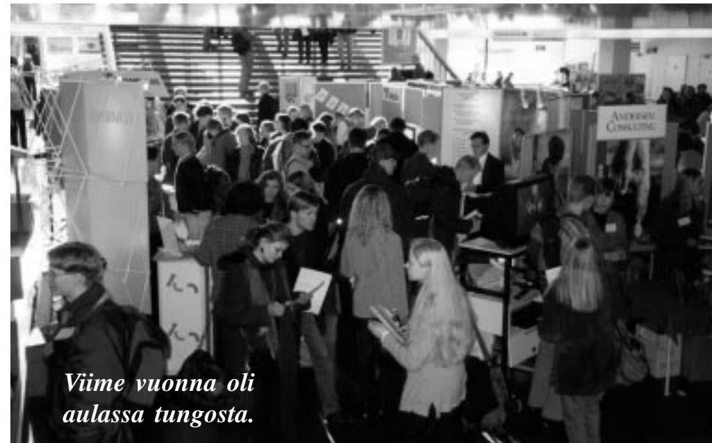
Viime vuonna oli aulassa tungosta.

tietotekniikan osaajia haetaan innokkaimmin